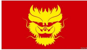
《经济学人》官网报道截图

How the world's two superpowers have become rivals