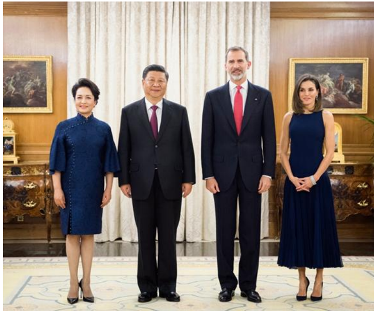
当地时间11月27日，国家主席习近平在马德里萨苏埃拉宫会见西班牙国王费利佩六世。这是习近平和夫人彭丽媛同费利佩六世和王后莱蒂西娅合影。