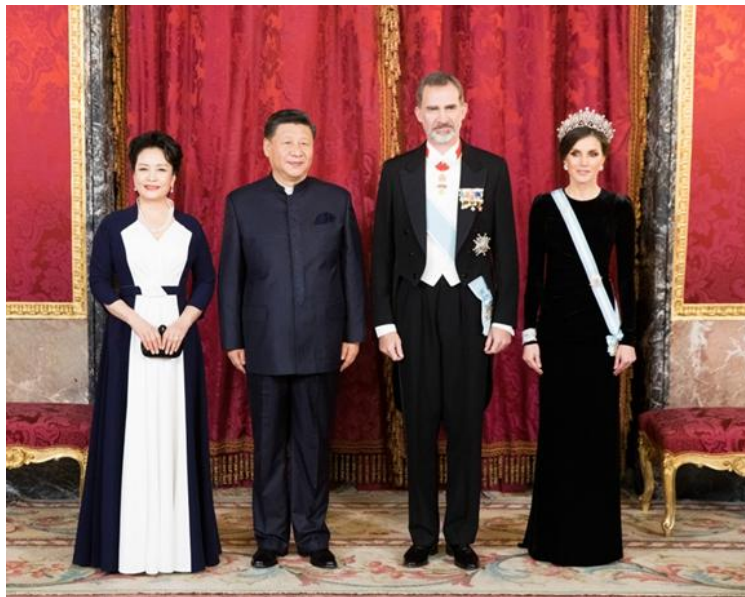
当地时间11月28日晚，正在西班牙进行国事访问的中国国家主席习近平出席西班牙国王费利佩六世在马德里王宫举行的隆重欢迎宴会。这是习近平和夫人彭丽媛同费利佩六世国王和莱蒂西娅王后合影。