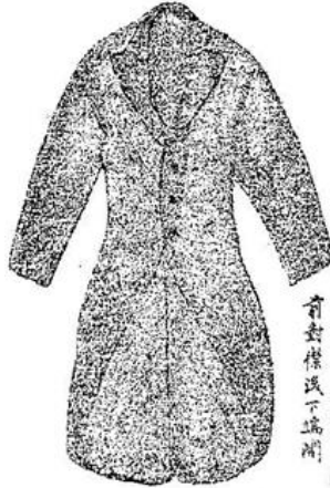
圖二第 (一) 服帶中畫 式禮佳