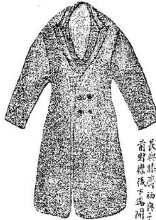
圖一第 (一) 服禮大用畫