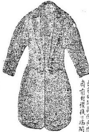
圖一第 (二) 式服禮大用晚