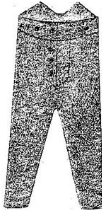
圖一第 (三) 式褲