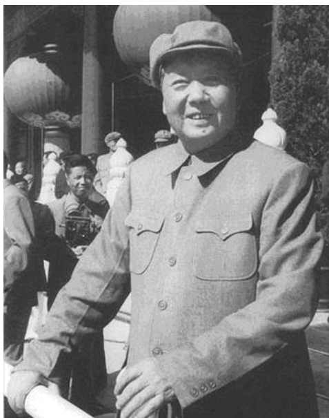
穿着“中山装”的毛主席