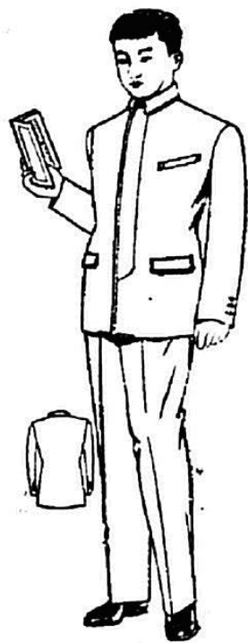
1958年剪裁书中的“青年服”形象

很多人对于什么是“青年装”可能不太熟悉，但只要问一下家中长辈就会发现，这其实曾经是上个世纪中国普遍流行的服饰。除了“青年装”，外形上十分相似的还有“劳动装”、“军便装”、“两用衫”等，由于时代变迁带来经济发展的同时，也丰富了我们这一代人的衣柜，以至于大家对于这些服饰逐渐淡忘了。