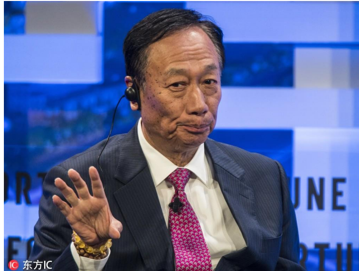
郭台铭（资料图/东方 IC）

郭台铭谈到巴西工人时说：“巴西人一听见‘足球’便会放下工作，还会整天跳舞，完全疯掉……以巴西作服务本地市场的生产基地还可以，但由巴西送货到美国，时间和成本比从中国运送更多。”