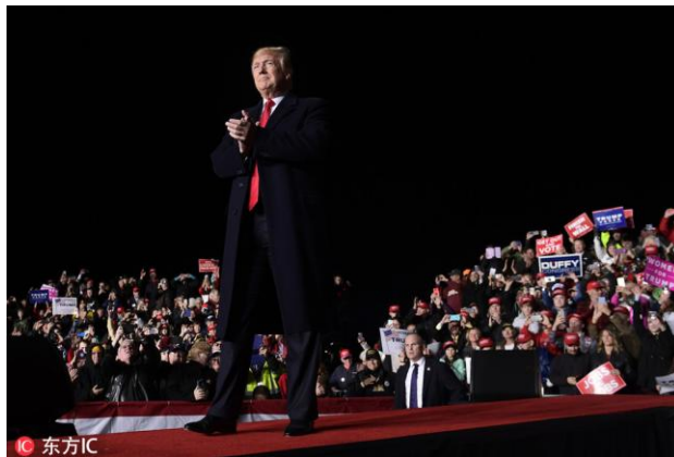
白宫或国会的控制权若发生变化，美国贸易保护主义或难以持续

中期选举已经让共和党丢掉了众议院，如果在下次总统选举中，白宫或国会的控制权发生变化，美国针对中国的贸易保护主义政策能否持续，就存在疑问。虽然中美关系确实发生了根本性的变化，但美国政府更迭后，一些原本就长期边缘化的强硬派人士，极可能被排除出决策的核心圈。中美博弈仍将持续，但会转变为其他形式。