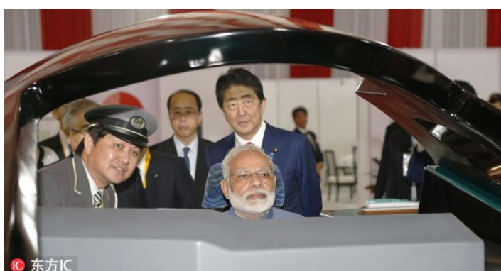
印度和日本合作的高铁计划近几年内恐难以实现。图为莫迪体验高铁模拟器

放眼全球，哪个国家能替代中国这个世界工厂的地位？印度？正好彭博社2018年10月17日报道称，日本在印度的高速铁路计划正因征地困难而陷入困境，在项目启动一年之后，铁路所需的1400公顷土地只征得了0.9公顷，导致该线路2023年完工的目标可能无法完成。由于征地进度过慢，日方已停止发放第二阶段的贷款，并估计2019年1月动工的计划难以实现。而印度方面此前甚至还要求铁路应在2022年竣工，现在却连原计划的2023年都很难实现了。