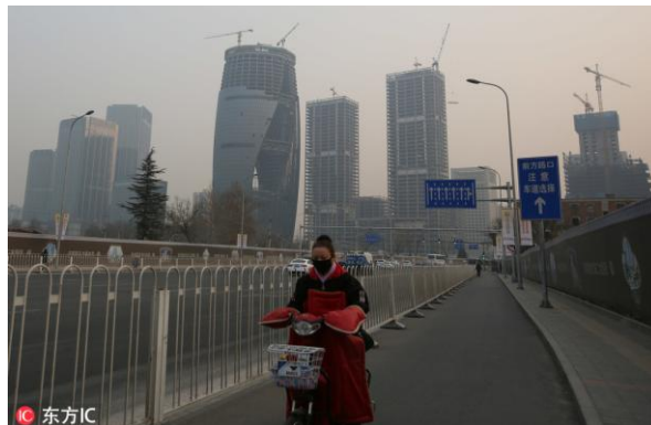
1月3日，北京局部陷入五级重度污染，能见度明显降低。

北京雾霾比较严重，为了应对气候变化，改善北京地区空气质量，我们就选择了一个“煤改气”的项目来支持中国。