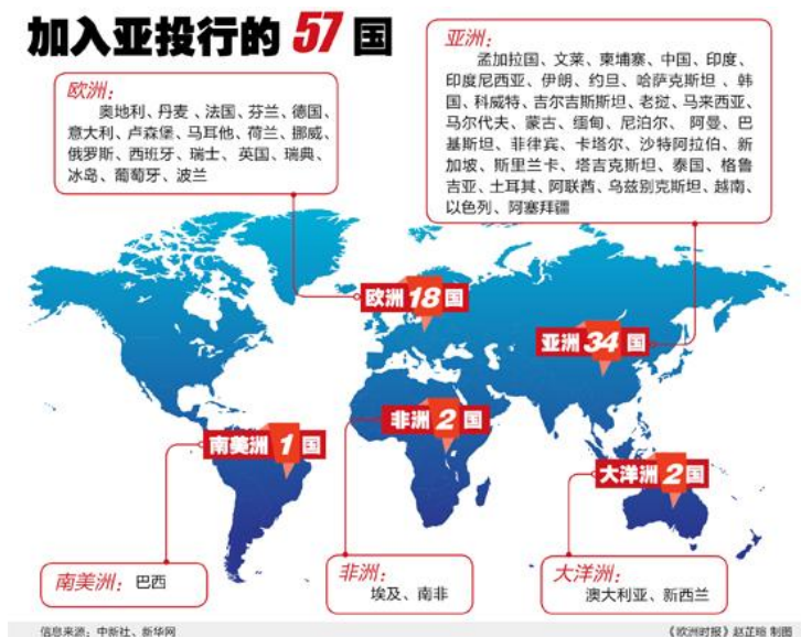
亚投行 57 个创始国

我在很多场合都说，亚投行的大门永远是敞开的，不会关闭。各国加入与否是他们自己的选择，但无论你是不是我们的成员，亚投行都愿意与你开展多方面合作。