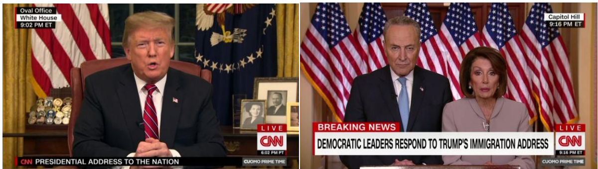
1月8日，舒默（左）、佩洛西（右）在特朗普全国讲话后立即回击

但是参议院多数党领袖米奇·麦康奈尔拒绝，他说：“政治噱头不会让我们取得任何进展。”他此前就明确表示，他不会在参议院提出任何特朗普不会签的与政府关门有关的法案。而民主党要求表决的法案没有为边境墙拨款，麦康奈尔认为特朗普不会满意。