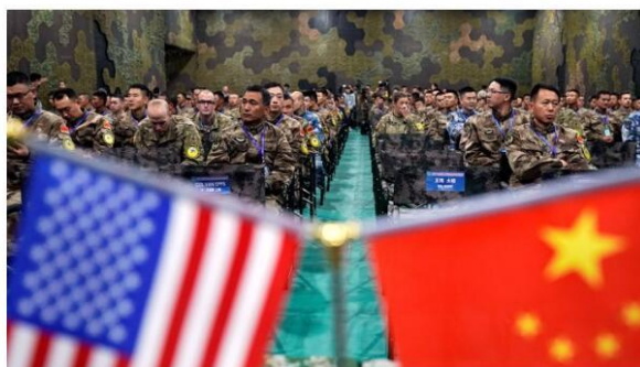
Personnel from the U.S. Army and the People's Liberation Army attend a closing ceremony of a "Disaster Management Exchange" near Nanjing, China, on November 17, 2018.

Kori Schake Contributing editor at The Atlantic and deputy director-general of the IISS