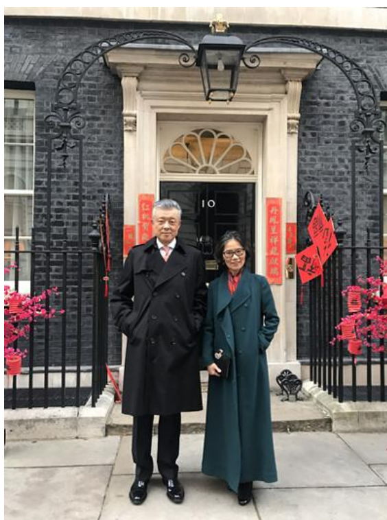
刘大使和夫人获邀参加招待会

“去年初我成功访华，与习近平主席和李克强总理举行了很好会晤，双方就推进英中关系‘黄金时代’达成重要共识。新的一年，英方期待与中方共同努力，推动两国各领域合作取得更多成果。”