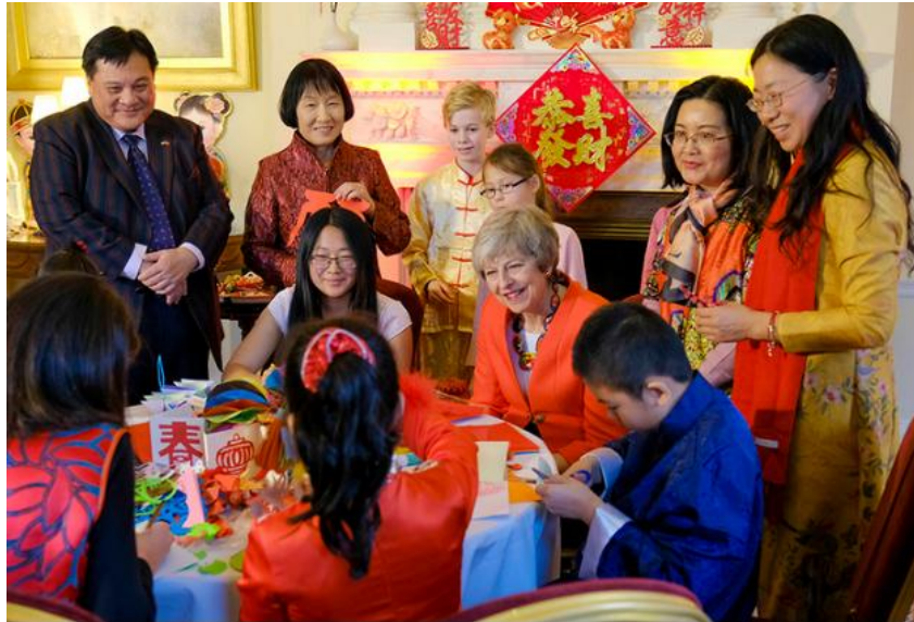
身着红装的梅特意和孩子们单独合影。

虽然梅姨团队身陷“脱欧”的艰难境地，但为了中国年，还是花了不少心思。往年的首相府门前没有张贴春联，而今年不仅是正门入口，首相府内的走廊两侧都贴上了春联。