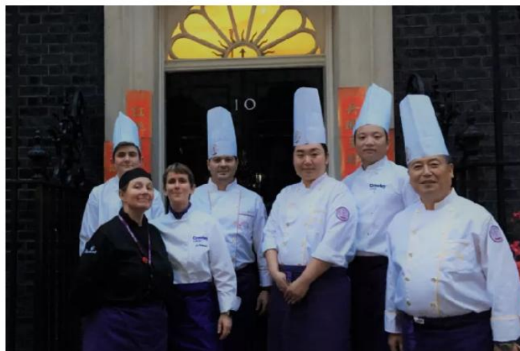
Crawley College students cook for the PM at 10 Downing Street