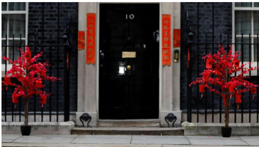
首相府门前第一次张贴春联

与往年不同的是——“丹凤呈祥龙献瑞，红桃贺岁杏迎春”，充满喜庆气氛的春联罕见地贴在唐宁街十号门前。