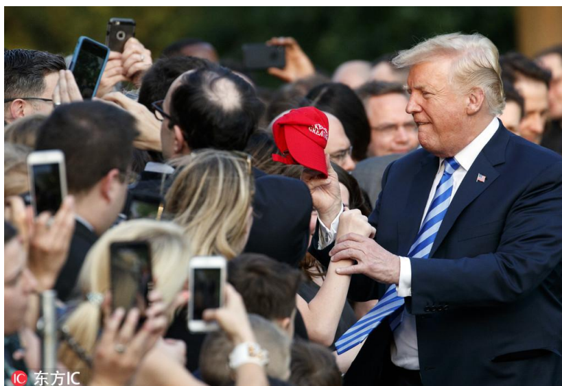
特朗普及其支持者（资料图/东方IC）

就目前非常有限的公开资料看，中美就贸易问题进行的谈判，已经形成三个分类框架，中美贸易问题被分成了技术性议题、结构性议题以及行动性议题三个部分：技术性议题基本上属于中美原本就可以相向而行的问题；结构性议题中有部分属于中国深化改革大方向一致的问题，有些属于美方的不合理出牌；行动性议题重在执行，可以确定的是，最终出现的应该是一种双向执行机制，而非美国曾经要求的单方施压机制。