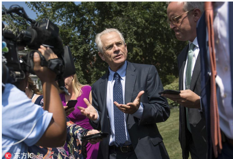
彼得·纳瓦罗

特朗普总统的贸易政策顾问纳瓦罗先生，在第六轮和第七轮中美贸易磋商中的出现率已显著地下降。这位纳瓦罗先生，是特朗普决策团队内持“美国就是可以任性，就是可以为所欲为”观点的最典型和最极端的代表。他坚持认定中国有求于美国超过美国有求于中国，其观点的强硬以及荒谬之处，在美方也是罕见的。