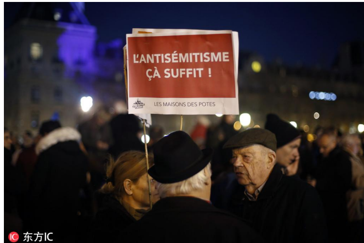
当地时间 2019 年 2 月 19 日，法国巴黎，当地民众参加对抗反犹太主义集会，抗议反犹仇犹行为。