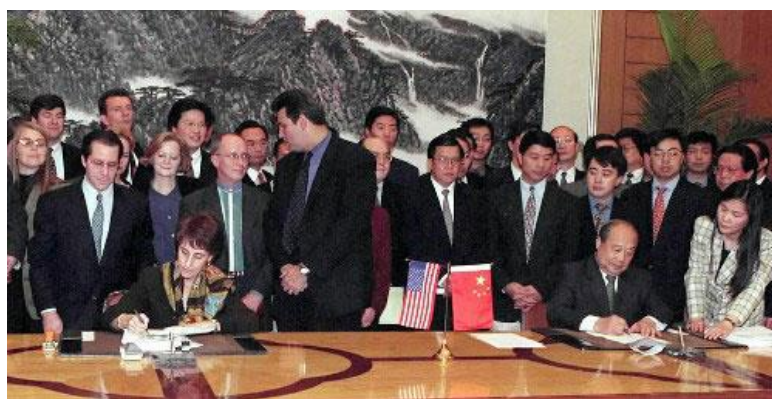
1999年11月15日，中美签署“入世”双边协议

中国加入世界贸易组织这个全球最大的多边贸易体制，极大地推动中国与世界的合作共赢，促进各种生产要素和产品在世界范围内的配置和流动，不仅使中国成为世界最大的货物贸易国，也使包括中国人民在内的世界各国人民，通过公平贸易，享受到中国和平发展所带来的红利。