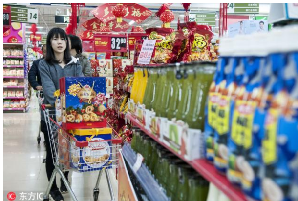
中国市场的消费潜力依然巨大

实践证明，中国和平发展的过程就是一个不断战胜各种挑战的过程。中国正在大力推动产业升级和消费升级，使中国经济从主要依靠外需拉动转入以内需拉动为主。这种内涵式发展的道路越走越宽广，中国有望成为世界最大的消费品市场。