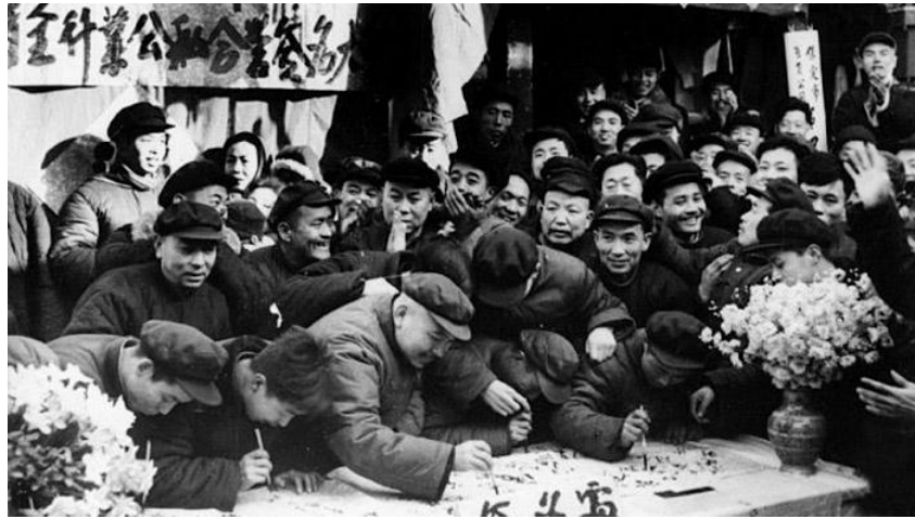
建国初期，中国共产党领导了对三大产业的社会主义改造，在中国建立了社会主义制度

中国的人民代表大会制度、中国共产党领导的多党合作和政治协商制度等一整套制度安排，使中国的决策过程和政策内容更能体现人民的整体和长远利益。