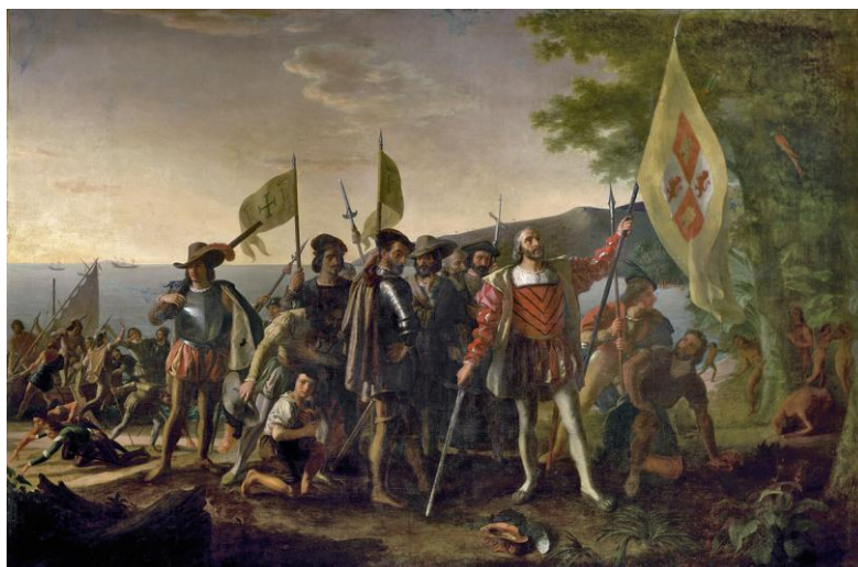
欧洲国家在殖民地的掠夺成为了工业革命的“第一桶金”

回顾世界近现代史，西方列强崛起的过程伴随着动荡与战争，充斥着暴力与血腥。从 16 世纪至 18 世纪，欧洲经常处于战争状态，造成生灵涂炭、民不聊生。在战争过程中，一些欧洲国家提升了军事实力、科技实力、战争动员能力，而其海外扩张和殖民掠夺，则为本国创造了有庞大资本、劳动力和原材料来源的国际市场。这些国家通过战争与殖民攫取了工业化所需的“第一桶金”。