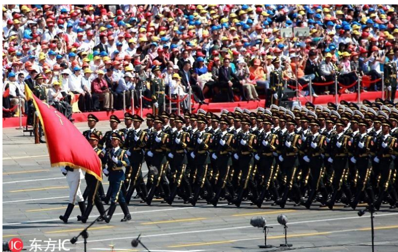
强大的国防力量是国家安全的保障

总之，有安全保障的和平发展，才是靠得住的和平发展。中国人这种底线思维和举措将伴随中国和平发展的整个进程，也将伴随我们构建人类命运共同体的整个过程。