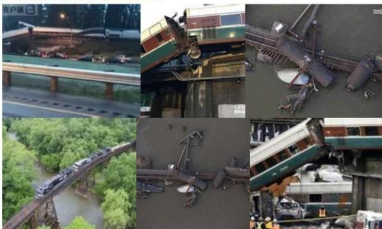
美国铁路出轨

多年来美国铁路重特大事故频繁发生，2007年11月30日，美国全国铁路客运公司在芝加哥南部的一起货运列车相撞事故造成多人受伤。2012年11月30日，美国新泽西南部小镇帕洛斯波罗一处铁路桥坍塌，造成货运火车出轨坠入河中，并导致火车上运载的剧毒氯乙烯泄漏。2013年5月，则在两周内发生三起事故，导致数十人受伤。去年9月29日，新泽西州一列开往纽约曼哈顿的通勤列车冲进车站，造成1人丧生，108人受伤。