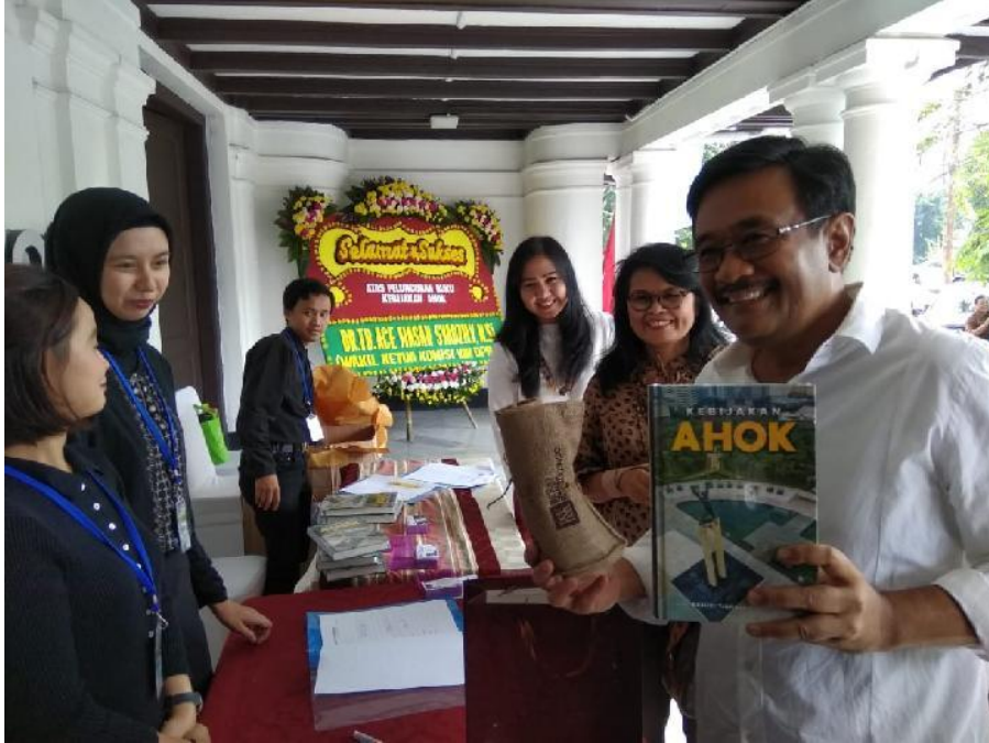
Mantan Gubernur DKI Jakarta Djarot Saiful Hidayat menunjukan buku karya Basuki Tjahaja Putnama berjudul Kebijakan Ahok di Gedung Filateli, Sawah Besar, Jakarta Pusat, 16 Agustus 2018.

TEMPO.CO, Jakarta - Basuki Tjahaja Purnama alias Ahok menerbitkan sebuah buku yang diberi judul Kebijakan Ahok . Buku ini adalah buah pemikirannya, yang ditulis selama ia berada dalam penjara. Buku itu sudah beredar secara online dengan harga Rp 1 juta.