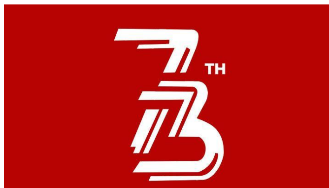
Logo HUT RI ke-73.

TEMPO.CO, Jakarta - Buku Kebijakan Ahok karya mantan Gubernur DKI Jakarta Basuki Tjahaja Purnama yang diluncurkan hari ini Kamis siang 16 Agustus merupakan kado spesial menyambut HUT RI 17 Agustus 2018 yang ke 73.