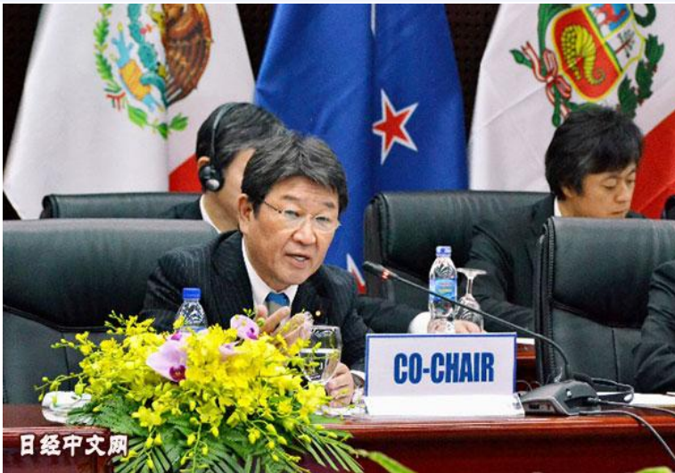
日本经济财政兼再生相茂木敏充在 TPP 部长级会议上（11月9日越南 岘港）

“与越南谈拢了”，会谈后，茂木对身边的人这样说。在8日晚亚太经合组织（APEC）会议的部长级官员晚宴上，日本经济产业相世耕弘成等贸易官员从宴会桌上请出加拿大和越南的部长级官员，分别进行游说。