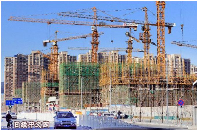
中国各地一直在推进住宅等基础设施建设（北京市郊外）

中国地方政府利用民间资金推进的基础设施建设业务接连中断。今年叫停了内蒙古自治区的地铁建设等近 1000 个项目。好像在担忧地方政府的财政恶化。十九大后，中国经济政策的重心由支撑经济运行逐渐转向抑制风险，中国领导层的这种姿态变得鲜明。