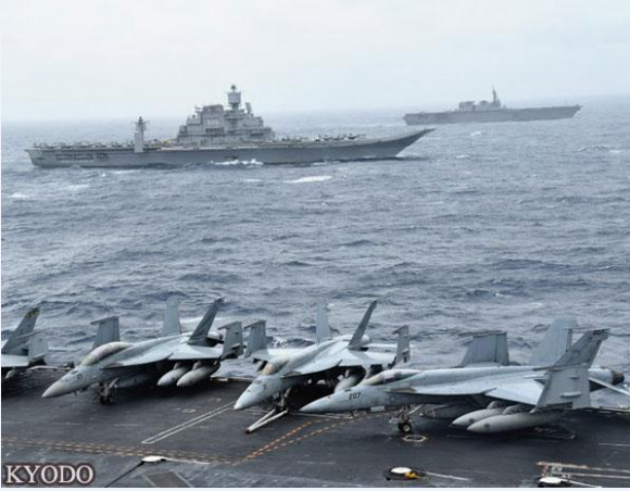
美国航母“尼米兹”号、印度航母“维克拉玛蒂亚”号、日本海上自卫队“出云”号在进行演习

目前问题是，中印两国是进一步加深对立，还是不久之后出现关系改善。即使存在各种曲折，但从长期来看前者的可能性很大。自中印战争以来，两国之间的不信任感不断积累，一带一路构想成为导火索。