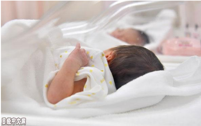
日本的新生儿（资料图）

日本在 1971 年至 1974 年的第 2 次婴儿潮期间出生的一代人现在大多 45 岁左右，生育高峰已经过去，这也导致了出生率的下降。