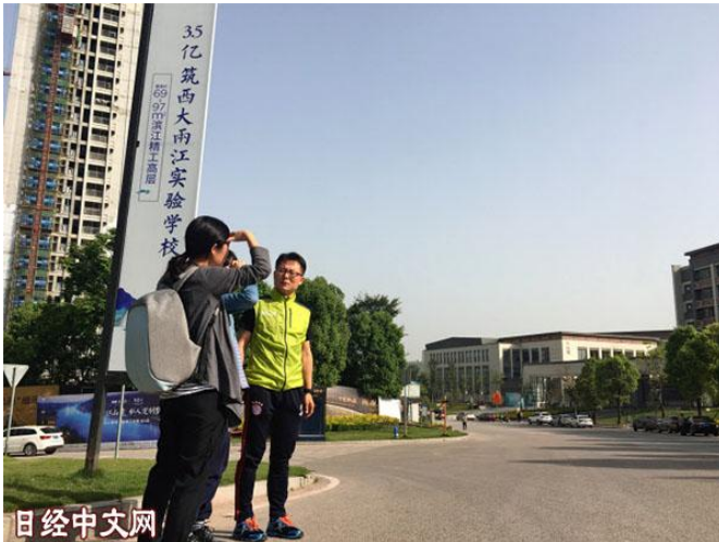
购买旁边在建小区的房子可进入右边的学校上学（重庆市内）

不仅是重庆，在江苏省南京市、湖北省武汉市和广东省深圳市等众多地方城市，学区房都炙手可热。房地产公司能够以较高价格销售楼盘，学校可以扩大事业，老师能够增加收入，消费者则能让孩子进入名校。尤其是北京等地区，政府管理严格，二手学区房的价格居高不下。