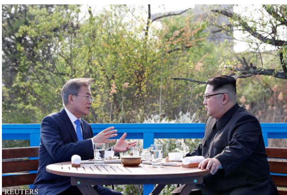
金正恩与文在寅4月27日在板门店

韩国纸媒《每日经济新闻》报道称，金正恩在与文在寅进行一对一会谈时作出了上述发言。