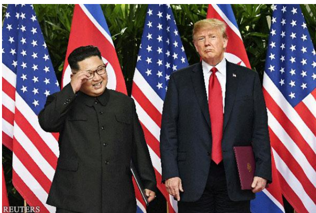
6月12日在新加坡举行了历史性的美朝首脑会谈

对于朝鲜来说会谈当然取得了巨大成功。这是因为在尚未确定无核化的时间和方法的情况下，朝鲜从美国得到了体制保证。朝鲜已经表明放弃同时推进核开发和经济建设的“并进路线”，改为集中力量发展经济。今后必将以无核化为诱饵，让国际社会放宽制裁和提供经济援助。