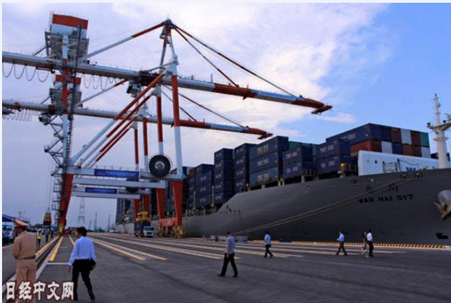
5月成为出口基地的越南北部首个大型港口开业（海防的莱县(Lach Huyen)国际港）

曾经历南北分裂的越南无法模仿这一点。如果不加以引导，外资将集中于基础设施完善的南部胡志明市，越南一直有意识地将电子、钢铁和石油化学产业吸引至首都河内所在北部和中部地区。5月投入运营的北部首个深水港海防国际集装箱港口的建设就是其中一环。