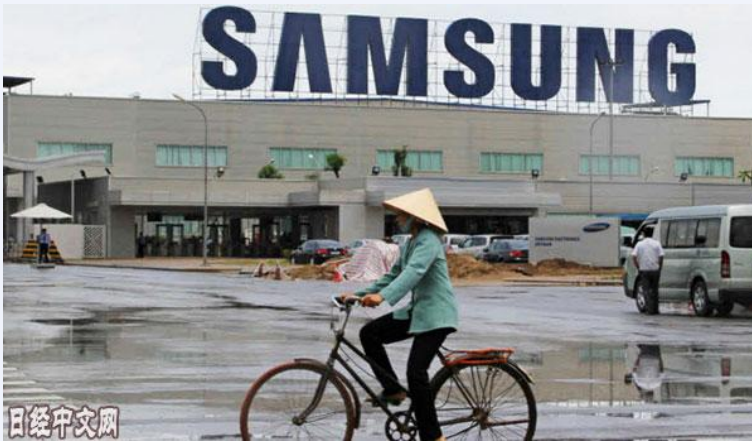
三星电子占越南出口整体的 2 成，因为位于越南北部北宁省的智能手机工厂

此次韩朝会谈，为之后的美朝会谈铺平道路的意义突出。在传递对华、对美想法方面，文在寅是最佳信使。