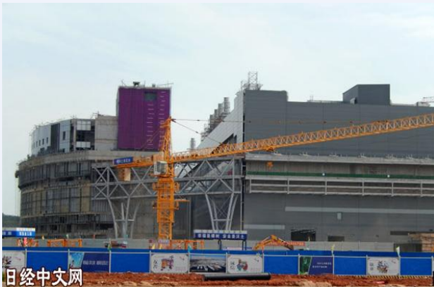
武汉郊外正在建设的芯片工厂。

6月，前往湖北省武汉市正在建设的 NAND 型闪存工厂，大型卡车正扬起灰尘进进出出。工厂所在的光谷地区汇聚半导体产业，写有“中国芯 光谷梦”（译者注：此处由日语翻译而成）的标语悬挂在附近。