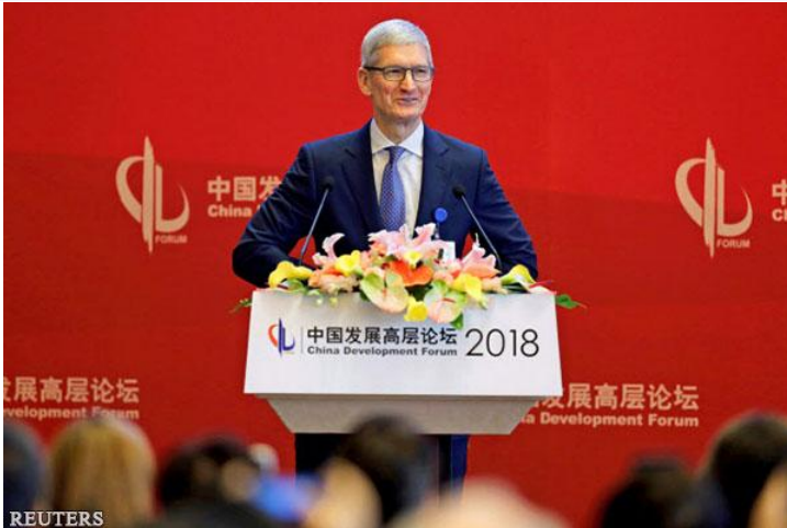
苹果公司 CEO 库克 2018 年 3 月在北京演讲

美国苹果的 iPhone 是策划和设计由美国负责、零部件在日本和韩国生产、组装放在中国这一国际分工的象征。但附加值的大部分属于控制商品策划和设计等“上游”、销售和售后服务等“下游”的美国。