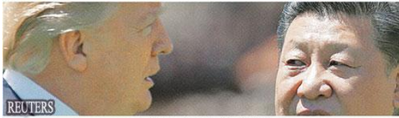
中美发动追加关税的状况