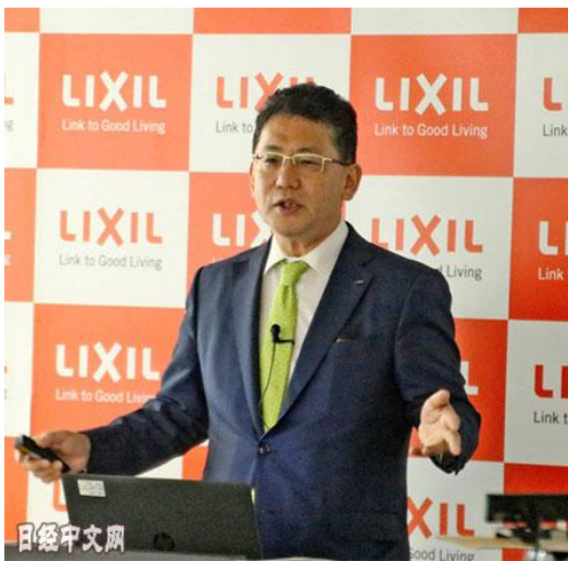
骊住集团(Lixil Group)的社长濑户欣哉 (7月31日)

目前，日本上市企业的业绩表现强劲，4~6月802家企业(截至8月3日，不含金融业)连续8个季度实现最终利润增长。包含日立制作所和机械制造商小松等在内，每4家企业就有1家创出利润新高。