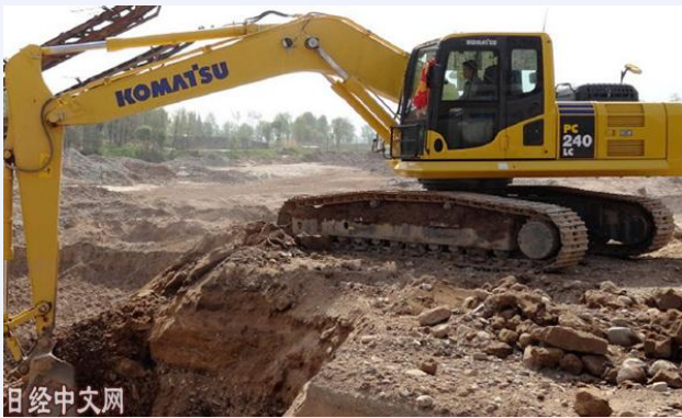
日本小松的挖掘机

第2个担忧因素是美国的高关税正使中国供应美国的产品和零部件失去竞争力。三菱电机的常务执行董事皮笠石齐在7月30日的财报发布会上表示，“如果产生影响，有些环节可以通过改变产地来应对”。在问卷调查中，很多日本企业讨论调整生产体制和包括原材料采购在内的整体供应链。