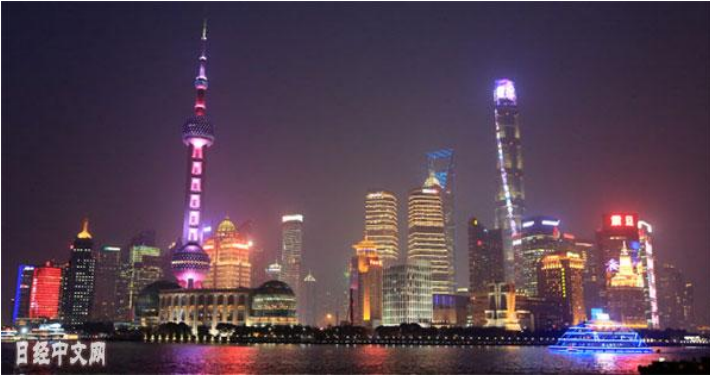
上海的街景呈现出泡沫经济时期东京和雷曼危机前纽约的气氛

泷田洋一：从十年前的金融，到眼下的贸易，中美两国围绕世界主导权展开了角逐。危机总是以另一幅面孔出现。新技术的大潮毫不留情地袭来，就连社会的面貌都在发生改变。机会与风险交错的中国城市仿佛处在岔道口的全世界的一个缩影。