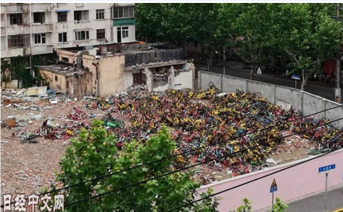
在建筑物死角的空地上，大量自行车随意堆放，形成一个“自行车坟场”

在建筑物死角的空地上，随意堆放着大量自行车。虽说有使用者骑后乱放的原因，但也存在经营者疏于回收的问题，宛若一个“自行车坟场”。本应是绿色环保的共享经济，却造成了严重的资源浪费。