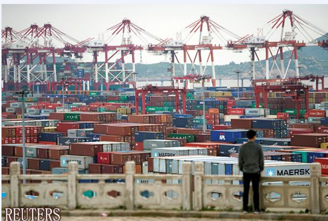
中国的港口

货币贬值将以多米诺骨牌效应袭击新兴市场国家。土耳其由于货币暴跌，进口物价上升，9 月的通胀率同比上涨 24.5%。南非连续 2 个季度出现负增长。IMF 于 9 日将新兴和发展中国家的 2019 年增长率预期下调 0.4 个百分点。