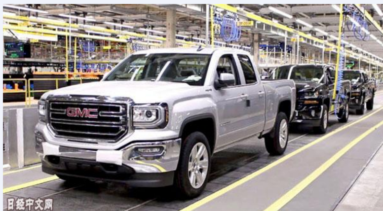
通用的加拿大奥沙瓦工厂将冻结新增投资

每年从中国购买约 29 亿美元零部件和材料的美国通用电气（GE）也表示，对华制裁关税“可能导致每年成本最多增加 3 亿~4 亿美元”。