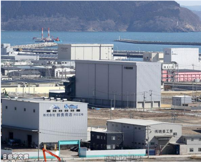
水产加工企业等林立的宫城县石卷市的沿海地区（3月9日）

宫城县的水产加工企业曾对申请补贴感到犹豫，但地方政府游说称，“只有现在才有预算”。很多企业押注经济重建，启动了设备投资。出现误判的是销售额并未复苏。