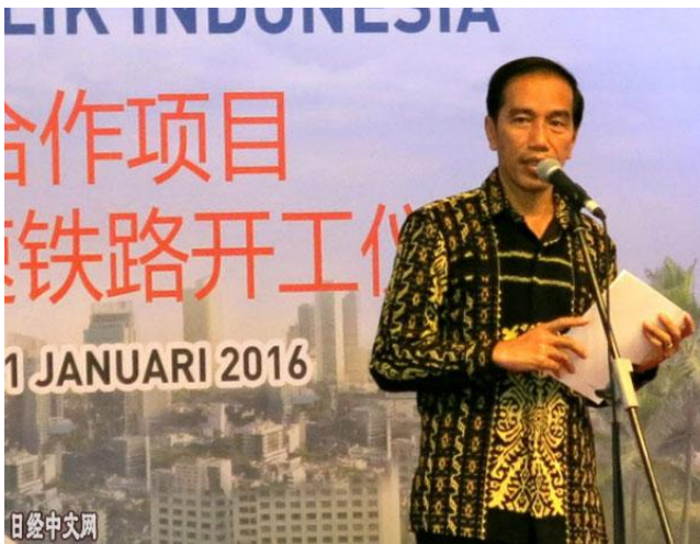
印尼总统佐科出席高铁项目开工仪式（2016年1月22日）

印度尼西亚的佐科政权针对中国参建的高铁项目启动了计划调整。原方案连接了印尼首都雅加达与主要城市万隆，印尼方面计划延长线路，将连接雅加达郊外的国际机场等，提升铁路的盈利能力。虽然该高铁线路已开工约2年，但建设完全未能取得进展，被迫进行调整。不过如果进行延长，成本增加将难以避免，能否实现仍是未知数。