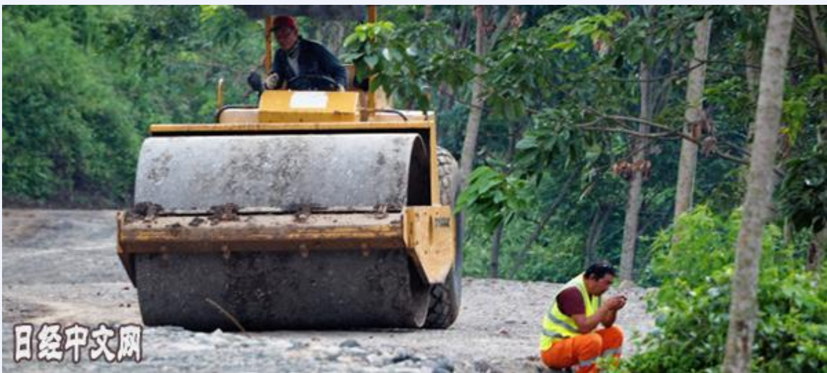
印度尼西亚万隆郊外的高铁建设计划用地

各方当初对征地的预期过于乐观。合资公司一度表示“已经完成了超过80%的征地”，但2017年8月突然下调至“55%左右”。此后的征地也毫无进展，因此资金筹措没有眉目。