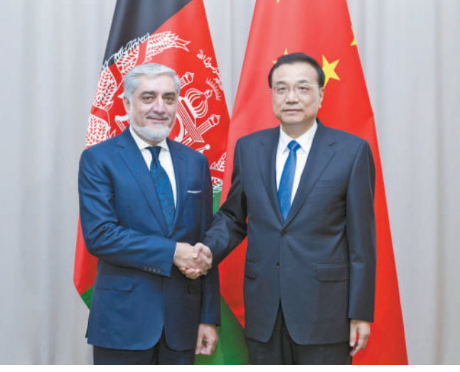
上图：当地时间12月1日，国务院总理李克强在索契下榻饭店会见白俄罗斯总理科比亚科夫。 中图：当地时间12月1日，国务院总理李克强在索契下榻饭店会见哈萨克斯坦总理萨金塔耶夫。 下图：当地时间12月1日，国务院总理李克强在索契雷迪森会议中心会见阿富汗首席执行官阿卜杜拉。