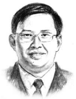
山东东营市委书记 申长友