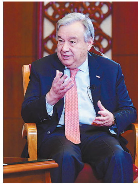
联合国秘书长古特雷斯在北京接受人民日报记者独家采访。