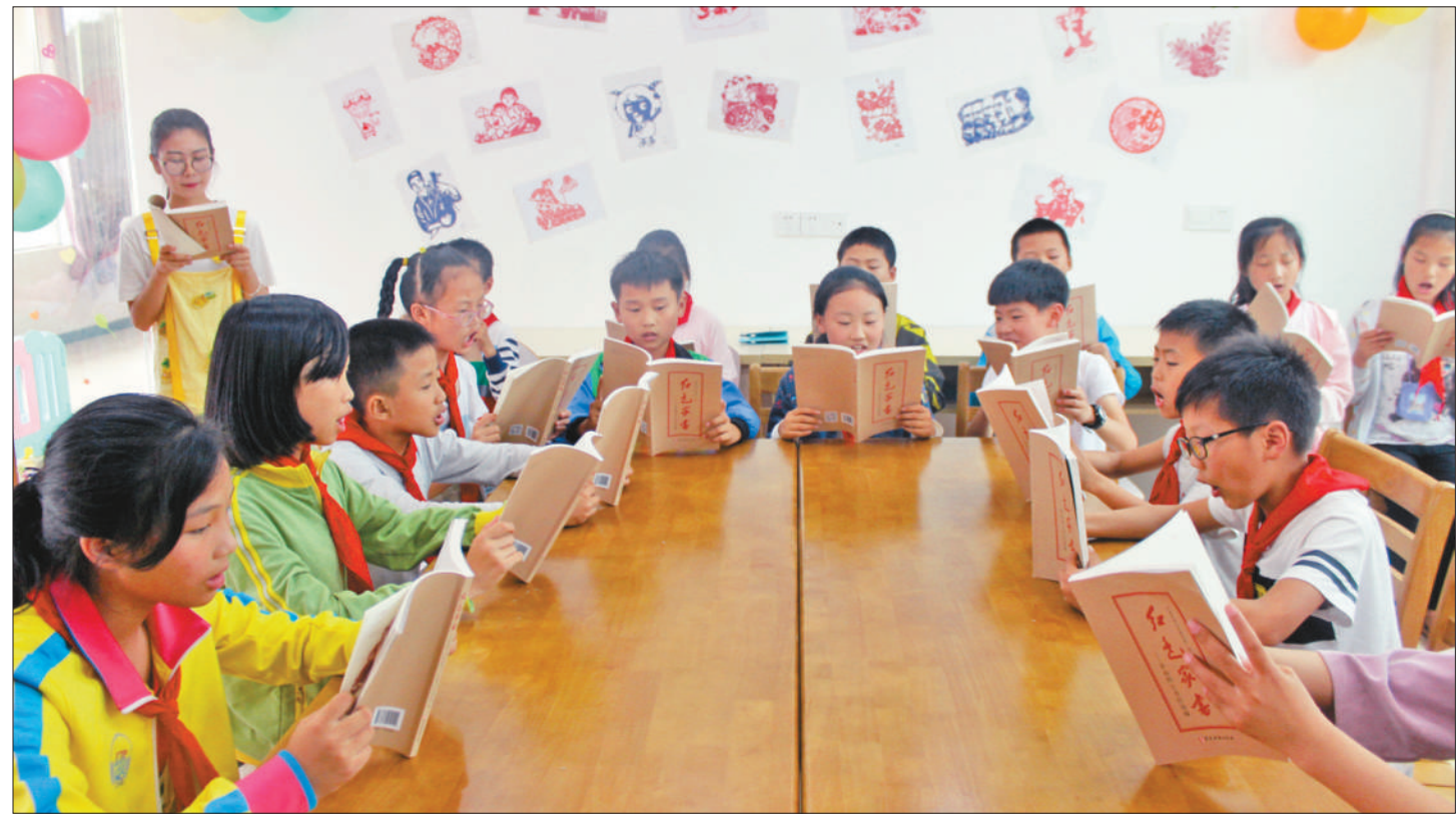
“六一”国际儿童节来临之际，江西省樟树市永泰镇组织留守儿童开展剪纸、画画、诵读《红色家书》、开展亲情视频等活动，让孩子们度过一个愉快的儿童节。图为孩子们诵读《红色家书》。魏本貌 王年如摄影报道

足以载入人类社会发展史册的世界性贡献。从闽东经验到中国实践，历史证明了习近平新时代中国特色社会主义思想立足时代之基、回答时代之问的科学力量。 这段用三十年写就的中国故事，赋予了我们打好脱贫攻坚战、决胜全面建成小康社会的定力与信念。闽东的扶贫成果，源自科学的方针、正确的方向，源自习近平新时代中国特色社会主义思想，也源自宁德人民笃定目标、持久发力的干劲。从现在到2020年，是全面建成小康社会决胜期，越是到了脱贫攻坚决胜阶段，就越要面对