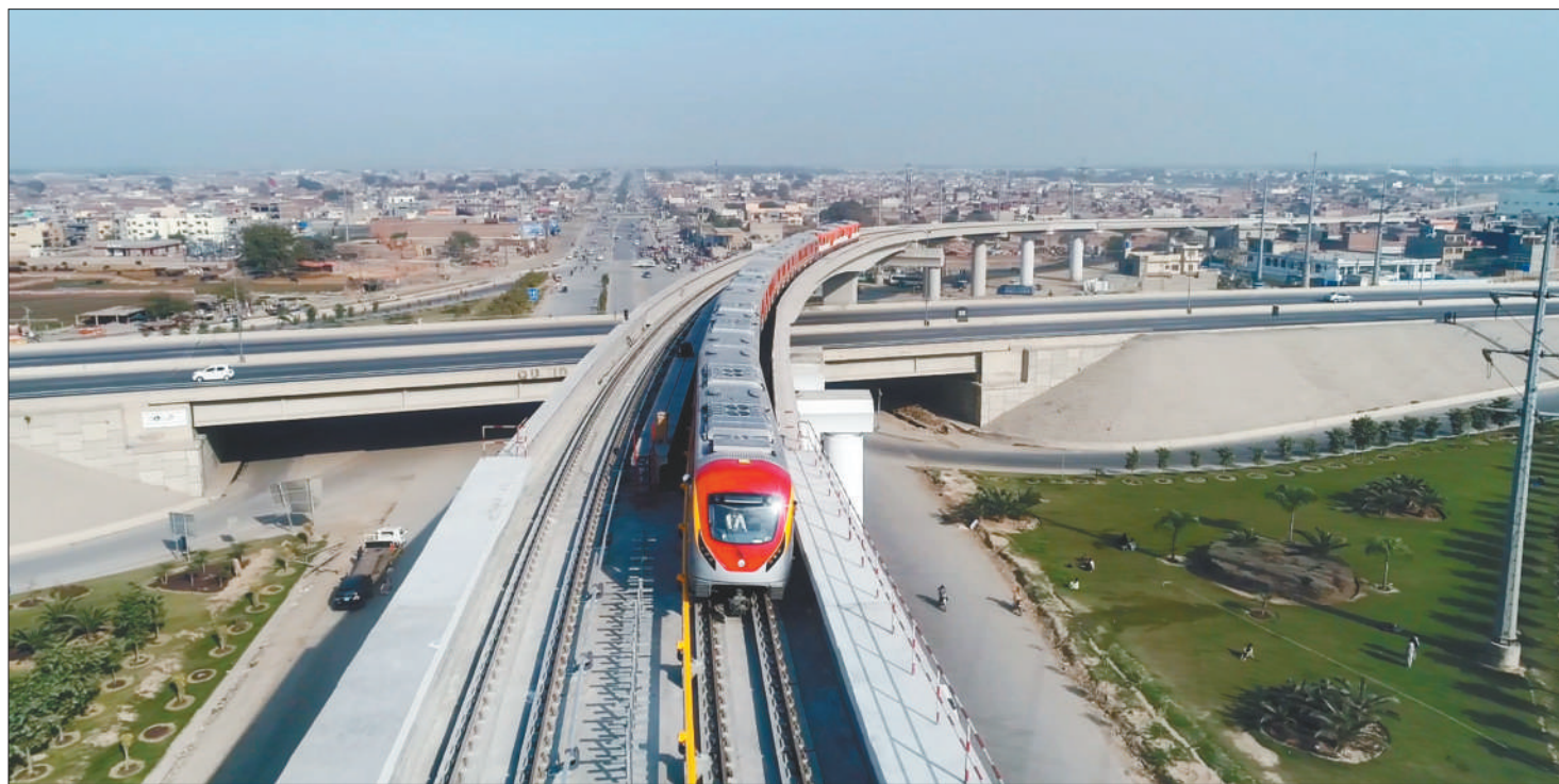
由进出口银行融资支持的巴基斯坦拉合尔橙线轨道交通项目。

数据显示,与民生领域密切相关的电力、热力、燃气以及水生产和供应等行业,是进出口银行对上合组织成员国贷款支持的主要投向。