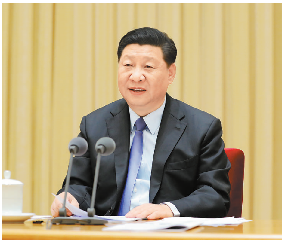
9月10日,全国教育大会在北京召开。中共中央总书记、国家主席、中央军委主席习近平出席会议并发表重要讲话,代表党中央向全国广大教师和教育工作者致以节日的热烈祝贺和诚挚问候。

习近平强调,要在坚定理想信念上下功夫,教育引导学生树立共产主义远大理想和中国特色社会主义共同理想,增强学生的中国特色社会主义道路自信、理论自信、制度自信、文化自信,立志肩负起民族复兴的时代重任。要在厚植爱国主义情怀上下功夫,让爱国主义精神在学生心中牢牢扎根,教育引导学生热爱和拥护中国共产党,立志听党话、跟党走,立志扎根人民、奉献国家。要在加强品德修养上下功夫,教育引导学生培育和践行社会主义核心价值观,踏踏实实修好品德,成为有大爱大德大情怀的人。要在增长知识见识上下功夫,