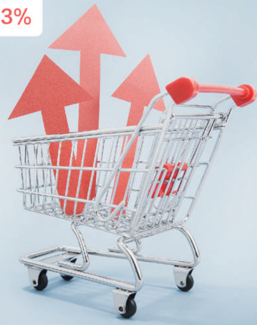
数据来源:国家统计局