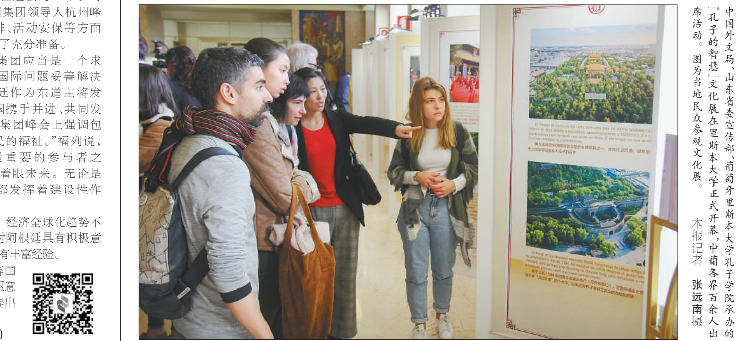
日前,由中国国务院新闻办办公室、中国驻葡萄牙大使馆主办,中国外交部、山东省委宣传部、葡萄牙里斯本大学孔子学院承办的“孔子的智慧”文化展在里斯本大学正式开幕,中葡各界百余人出席活动。图为当地民众参观文化展。