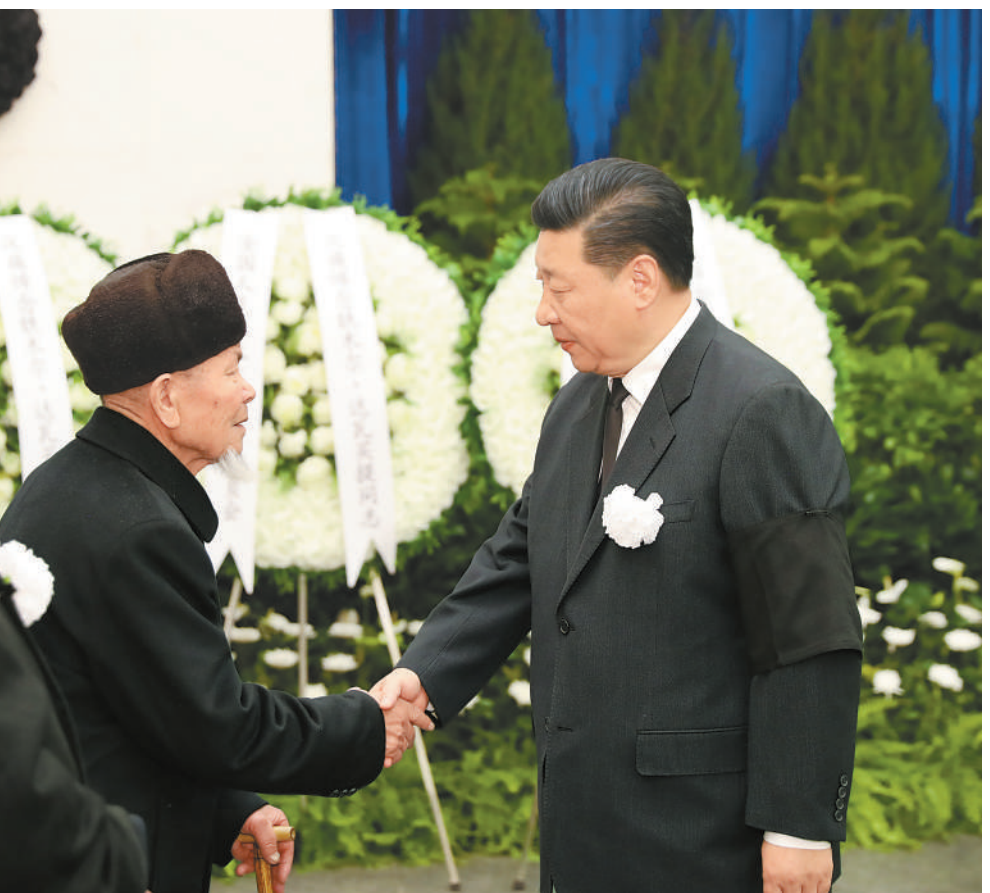
12月21日,铁木尔·达瓦买提同志遗体送别在北京八宝山革命公墓举行。习近平、李克强、栗战书、汪洋、王沪宁、赵乐际、韩正、王岐山等前往八宝山送别。这是习近平与铁木尔·达瓦买提亲属握手,表示深切慰问。

铁木尔·达瓦买提同志病重期间和逝世后,习近平李克强栗战书汪洋王沪宁赵乐际韩正王岐山江泽民胡锦涛等同志,前往医院看望或通过多种形式对铁木尔·达瓦买提同志逝世表示沉痛哀悼并向其亲属表示深切慰问