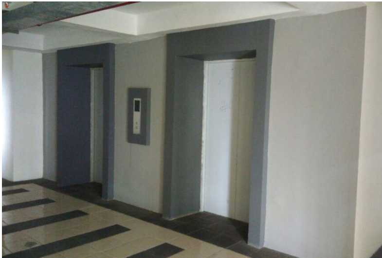
Lift yang tersedia di Rusun KS Tubun yang terletak di Jalan KS Tubun, Kota Bambu Selatan, Palmerah, Jakarta Barat.

Tri mengatakan, nantinya rusun ini akan dikelola oleh Unit Pengelola Rumah Susun (UPRS) Jati Rawasari yang semula hanya bertugas mengelola Rusun Jati Rawasari dan Rusun Karanganyar.