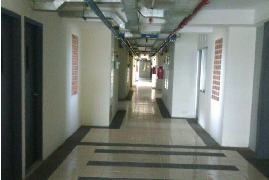
Unit-unit hunian Rusunawa KS Tubun yang terletak di Jalan KS Tubun, Kota Bambu Selatan, Palmerah, Jakarta Barat.