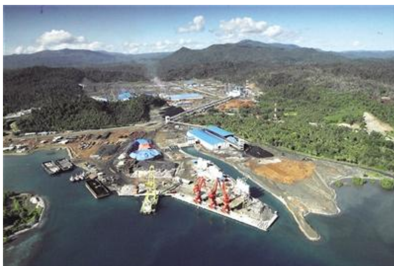
△印尼青山工业园区全景

青山系企业从1992年开始一直专注于不锈钢生产，经过26年的发展，已经成长为一个大型的民营企业集群。2016年，青山系企业的不锈钢粗钢产量为580万吨，销售收入1028亿元人民币，员工3万多人。2017年产量为748万吨，居全国第一，亦是全球第一。