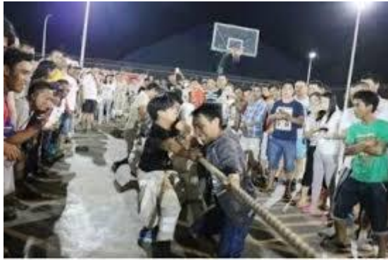
△ 印尼青山工业园区的宿舍区、球场、员工活动中心

我们在印尼的工业园区有 2012 公顷土地，但只用 600 公顷来建设。因为这个地方土地多，价格便宜，而且印尼法律有规定，政府批准的工业用地，只能有 60%的土地用于建设，40%必须保留，不能动。