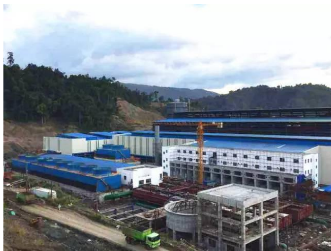
△印尼青山工业园区鸟瞰图

2013年10月3日，中国国家主席习近平和时任印尼总统苏西洛出席在印尼雅加达举行的中国—印尼商务协议签约仪式，印尼青山工业园区作为其中的项目之一成功签约。也就是在这次印尼出访中，习主席向全球提出构建“21世纪海上丝绸之路”的倡议。