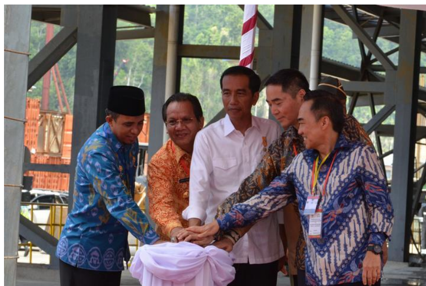
△2015年5月29日，印尼佐科总统（左三）亲临青山工业园区，宣布首个入园项目正式投产并发表重要演讲。