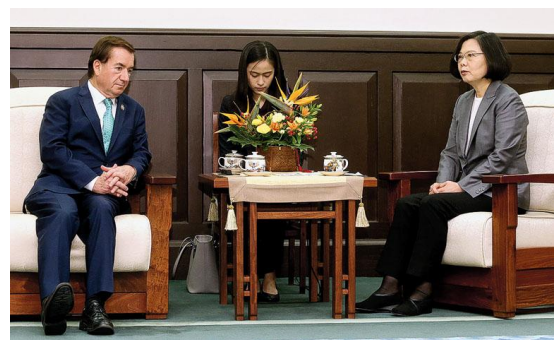
美國商務部副助理部長史宜恩 美國副助理國務卿黃之瀚 蔡英文會見美國眾議院外交委員會主席羅伊斯

在中美貿易戰的喧囂中，美國的「台灣牌」突然亮出，這是一個超過貿易戰本身的危險信號。美國總統特朗普繼通過「國防授權法」，即容許美台軍艦互訪之後，他又親自簽署了「台灣旅行法」，允許美台高層可以互訪，這就打破了中美建交以來的默契。「台灣旅行法」剛生效，美國國務院負責東亞和太平洋事務的副助理國務卿黃之瀚 (Alex Wong) 就率先訪台，他在美國商會的晚宴上與台灣總統蔡英文共同舉杯的影像，極具政治視覺效果。