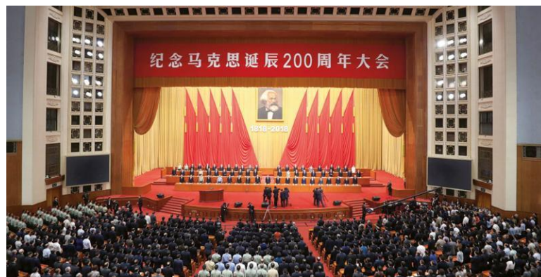
在北京舉行紀念馬克思誕辰二百週年大會

就像春夏之交的驚雷，中國在馬克思誕辰二百週年之際，罕有高調地紀念。五月四日，也就是「五四運動」的紀念日，中共召開了馬克思二百週年誕辰的隆重紀念大會，中共七常委全部出席，中共總書記習近平發表重要講話，讚譽馬克思是「千年第一思想家」，馬克思主義也是中國共產黨的最根本的合法性基礎。央視並推出五集大型專題節目《馬克思是對的》，匯聚了專