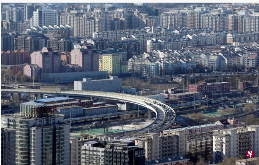
中国北京繁华的街景。

2018 年 1 月 12 日 星期五 03:30 AM 文/林子恒 来自/联合早报