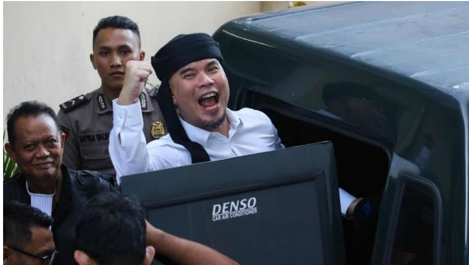
Ahmad Dhani

Jakarta - Mahkamah Agung (MA) menolak kasasi yang diajukan Ahmad Dhani Prasetyo. Alhasil, pentolan Dewa 19 itu dinyatakan terbukti menyebarkan kebencian suku, agama, ras dan antargolongan dan dihukum 1 tahun penjara.