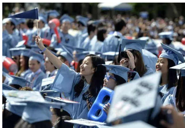
▲2015年5月20日，几名来自中国的国际学生在哥伦比亚大学毕业典礼上。

而美国的猜忌也已转化为实际行动，通过缩短理工科留学生的签证有效期并加强审查等举措，限制中国公民赴美学习。