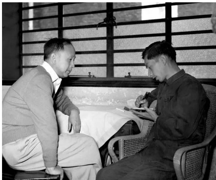
▲著名科学家钱学森（左）回到祖国后接受新华社记者采访（1955年10月摄）