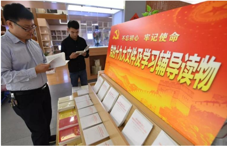
心中有信仰，奋斗有力量。图为 2017 年 10 月 30 日，读者翻阅党的十九大文件及学习辅导读物。

导力量已是中国无产阶级及其政党，这就决定了它属于新兴的世界社会主义运动的一部分，其前途是社会主义。第三，发现中国革命的特殊道路，即农村包围城市、武装夺取政权，它既体现了现代历史条件下城市的中心地位，又体现了中国具体历史发展的水平。第四，发现了确保中国革命胜利的“三大法宝”，即统一战线、武装斗争和党的建设，它既反映了世界无产阶级革命的一般要求，也反映了中国革命实际的特殊要求。站在世界历史的高度认识和解决中国问题，把中国的命运和世界的命运紧密联系在一起，这就是中国共产党领导的伟大社会革命在理论、实践和历史中交汇的轨迹。中国特色社会主义的发展正是沿着这一轨迹，才使被长期压抑的具有几千年文明底蕴的民族活力如火山爆发般地迸发出来，实现了孙中山先生未能实现的唤起民众、联合世界上平等待我之民族的遗愿，团结一致地开创中华民族伟大复兴的伟业。