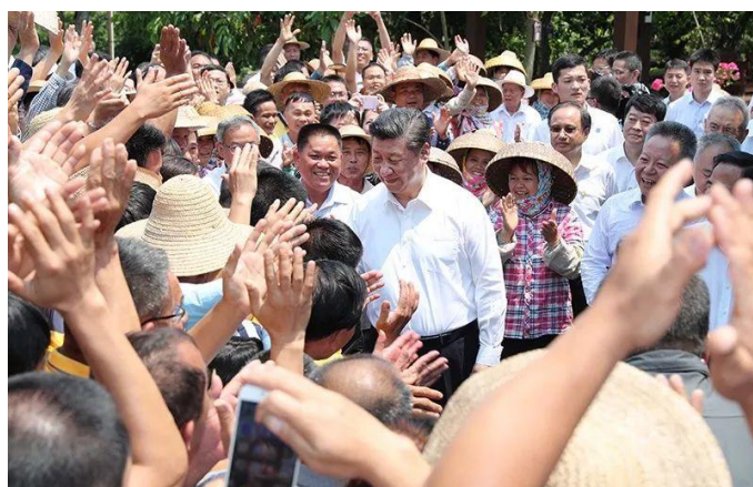
2018年4月11日至13日，中共中央总书记、国家主席、中央军委主席习近平在海南考察。这是4月13日上午，习近平在海口市秀英区石山镇施茶村考察时，同闻讯前来的村民亲切握手。

要把乡村振兴战略这篇大文章做好，必须走城乡融合发展之路。我们一开始就没有提城市化，而是提城镇化，目的就是促进城乡融合。要向改革要动力，加快建立健全城乡融合发展体制机制和政策体系。要健全多元投入保障机制，增加对农业农村基础设施建设投入，加快城乡基础设施互联互通，推动人才、土地、资本等要素在城乡间双向流动。要建立健全城乡基本公共服务均等化的体制机制，推动公共服务向农村延伸、社会事业向农村覆盖。要深化户籍制度改革，强化常住人口基本公共服务，维护进城落户农民的土地承包权、宅基地使用权、集体收益分配权，加快农业转移人口市民化。