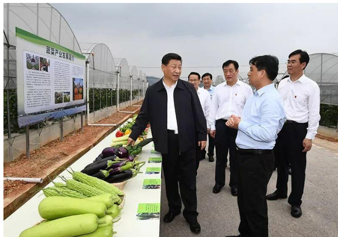
2019年5月20日至22日，中共中央总书记、国家主席、中央军委主席习近平在江西考察，主持召开推动中部地区崛起工作座谈会并发表重要讲话。这是习近平在赣州市于都县梓山富硒蔬菜产业园考察调研。

同时，我们也要看到，同快速推进的工业化、城镇化相比，我国农业农村发展步伐还跟不上，“一条腿长、一条腿短”问题比较突出。我国发展最大的不平衡是城乡发展不平衡，最大的不充分是农村发展不充分。党的十八大以来，我们下决心调整工农关系、城乡关系，采取了一系列举措推动“工业反哺农业、城市支持农村”。党的十九大提出实施乡村振兴战略，就是为了从全局和战略高度来把握和处理工农关系、城乡关系。