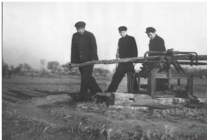
1954年，毛泽东在顺义县农村视察

直到去世，在毛泽东卧室床边还摆放着他经常阅读的至少三个版本的《共产党宣言》。这恰恰印证了马克思主义理论著作与毛泽东一生相伴的事实。他是真学真信真奉行，是一个完全彻底地为人民利益和共产主义事业奋斗终身的伟大的马克思主义者。