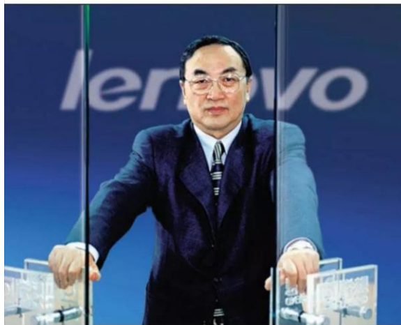
图为联想控股董事长柳传志。（资料图）