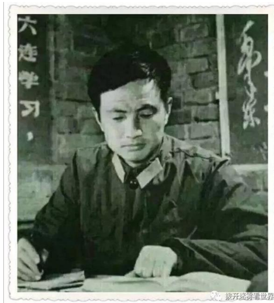
学习毛泽东思想标兵

我们都知道任正非在企业管理中非常喜欢引用毛主席的语言和战略：比如“农村包围城市”、《反骄破满，在思想上艰苦奋斗》、《华为的红旗到底能打多久》、《要从必然王国走向自由王国》、《在自我批判中进步》以及《目前形势与我们的任务》等等。