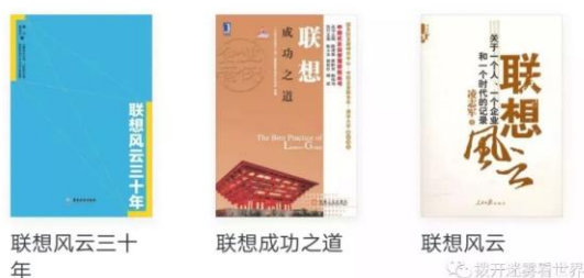
从歌功颂德的文字中发掘真相