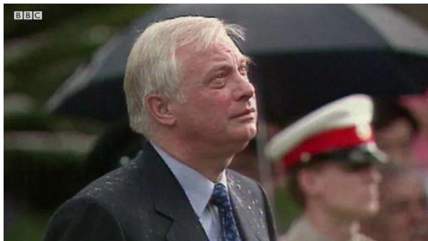
一方势力是那些有着所谓“香港情结”的英国人，比如末代港督彭定康等。

恋殖派遭到迈克尔·坦纳这样仗义执言者的批评和不屑，但也确实博得英国至少两方势力的“同情”。这些势力在如今的香港乱局中依然跳得最欢。