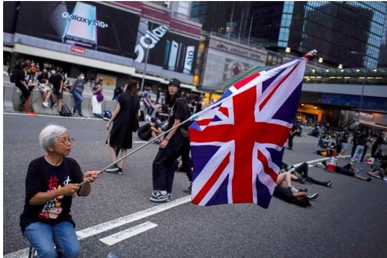
但王凤瑶等“恋殖派”举米字旗博英国同情，其实早就被打过脸了。

2014年“占中”和2017年“反水客”期间，英国作家迈克尔·坦纳多次在社交媒体发文，谴责香港示威者举着英国国旗壮胆的行为，警告他们“不是英国人，不要举英国国旗”。