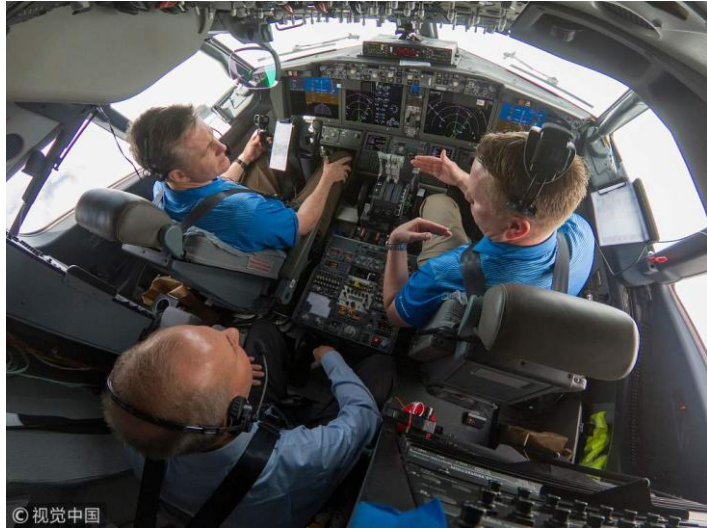
3日波音 CEO 米伦伯格与波音试飞员一道，参加了一次验证 MCAS 软件升级的测试飞行