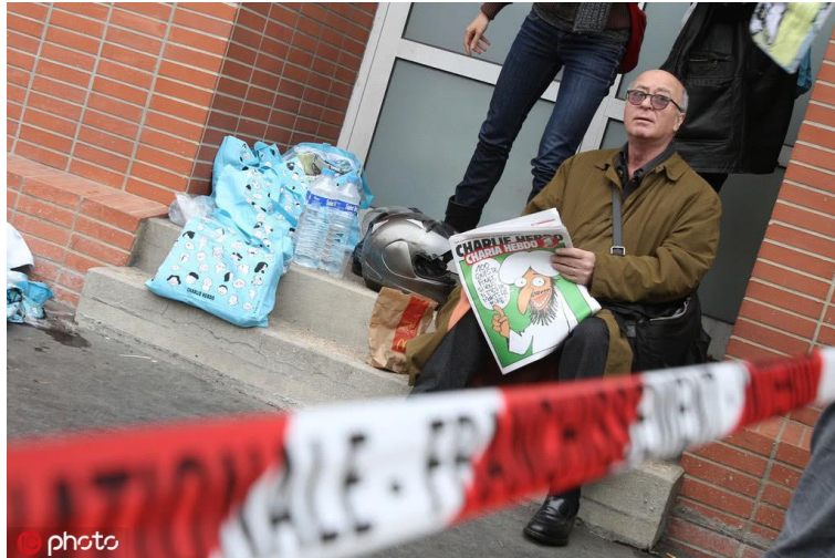
法国查理周刊事件

所以我觉得中国人讲究权利和义务之间的平衡，是一个真正的普世价值。一定要实现这种平衡，光是讲权利不讲义务，这个权利是玩不下去的。所以我觉得中国人这个观点是代表未来的。