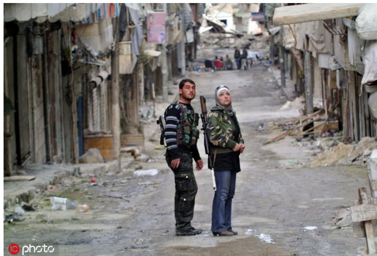
战争中的叙利亚

大家知道今天的欧洲面临一个很大挑战，就是中东难民问题，实际上这也和人权有关。我们可以从欧洲处理难民的困境，看到欧洲这种所谓价值观外交、人权外交的破产。阿拉伯之春很快变成了阿拉伯之冬，利比亚陷入无政府状态。也门同时进行着我叫做三到四场战争，一个2,000万人口都不到的国家，同时有部落之间的战争，族裔之间的战争，宗教之间的战争，还有南北方之间围绕国家分裂和统一的战争。最悲惨的还是叙利亚，这个国家我15年前去过，当时应该算是一个比较和平繁荣的国家，大概相当于中国80年代的水平。但今天，这国家一半的人口成为难民，主要的城市几乎都被摧毁。