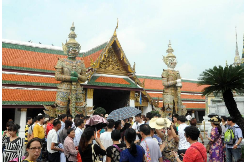
中国游客在泰国

还有一个观点我上次也讲过，尤其是针对美国人，美国人特别喜欢质疑人权问题，并且提出普世价值。如果你要谈人权问题的话，21 世纪对人权最大的侵犯，就是美国发动的伊拉克战争，死亡的平民百姓人数最保守估计是十几万，有的说是三四十万，流离失所的平民老百姓达到几百万，根本都没法统计。