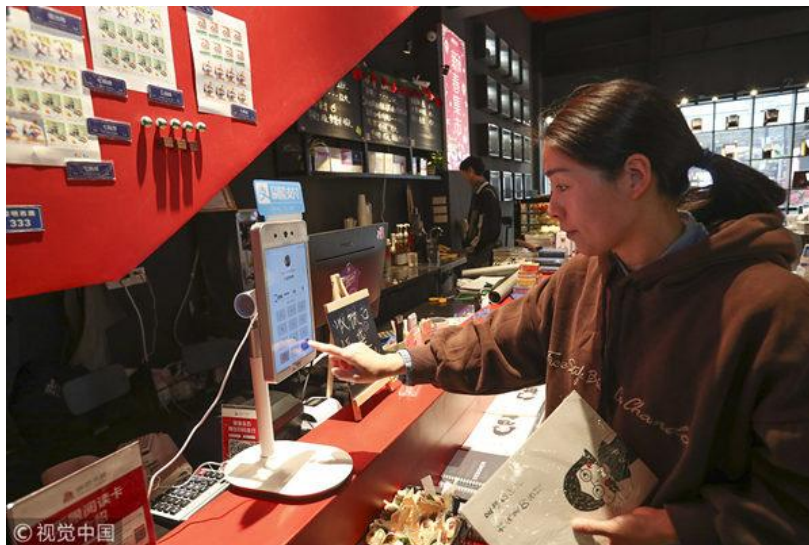
2019 年 1 月 16 日，在浙江省温州市鹿城区五马商业街，购物市民通过“刷脸”完成支付。

在中国新的增长模式中，有一个关键特征是在领导人规划之外的，当然就更别说获得什么产业政策的扶持了：那就是着眼消费的创新产业。它在 2008 年以前几乎不存在，但如今却在对中国经济发挥越来越重要的推动作用。